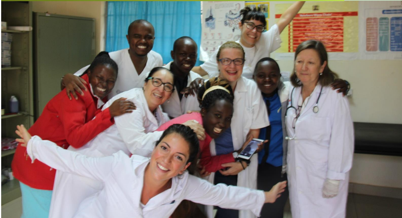
VOLUNTARIOS EN EL CENTRO DE SALUD DE KIONGWANI