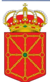
Gobierno de Navarra