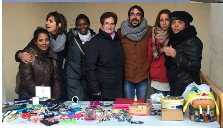
PÁRROCO, DIACONO Y CATEQUISTAS DE AUTOL