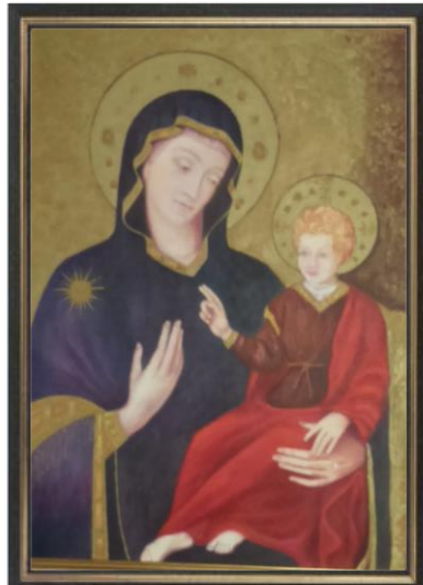
María Salus Infirmorum

Somos una Asociación sin ánimo de lucro, de orientación católica, que pretende vivir el Evangelio de Cristo, de Aquel que pasó por el mundo haciendo el bien y curando todo tipo de enfermedad: pobreza, injusticia, marginación, enfermedades, del cuerpo y del espíritu.